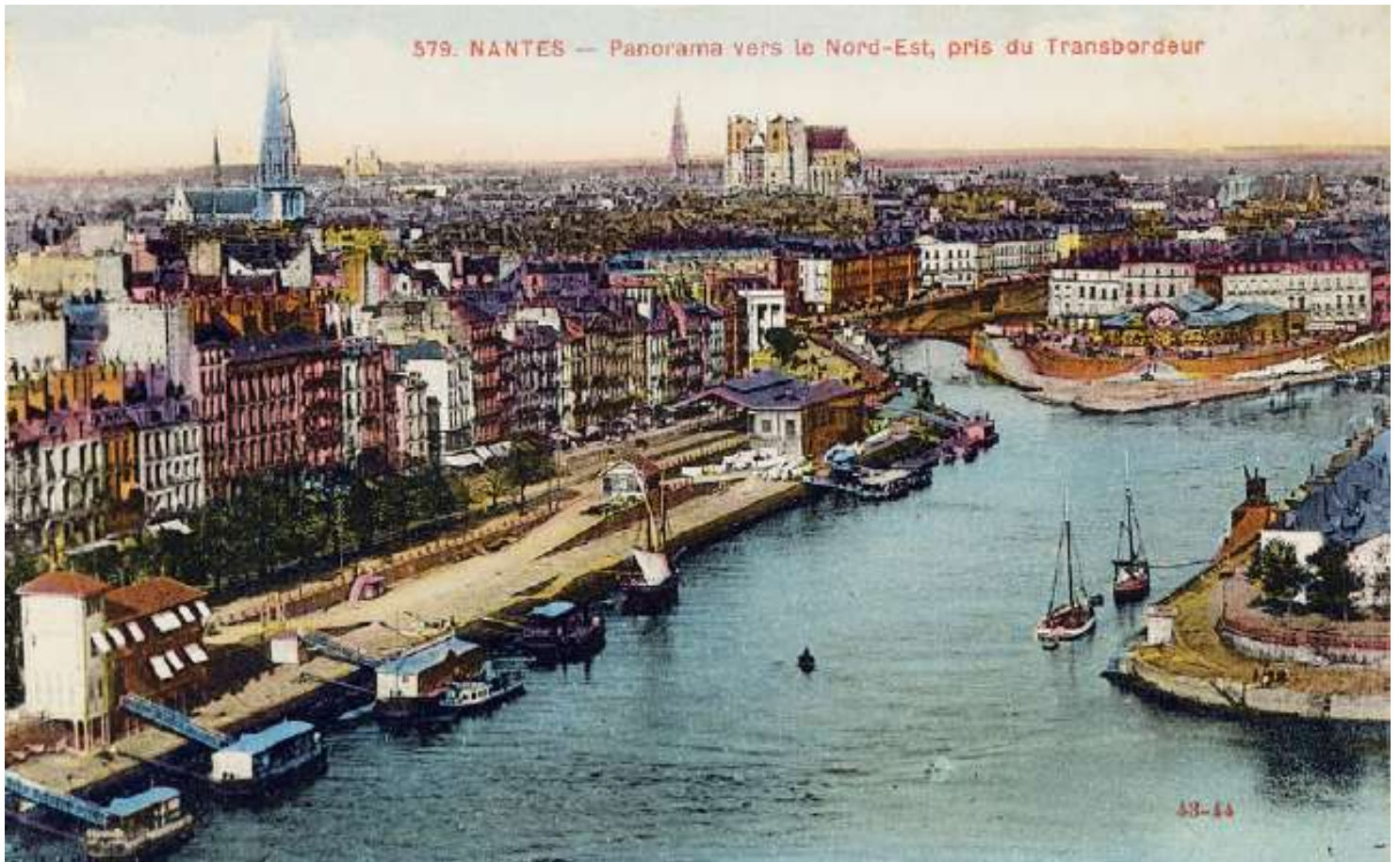
579. NANTES — Panorama vers le Nord-Est, pris du Transbordeur